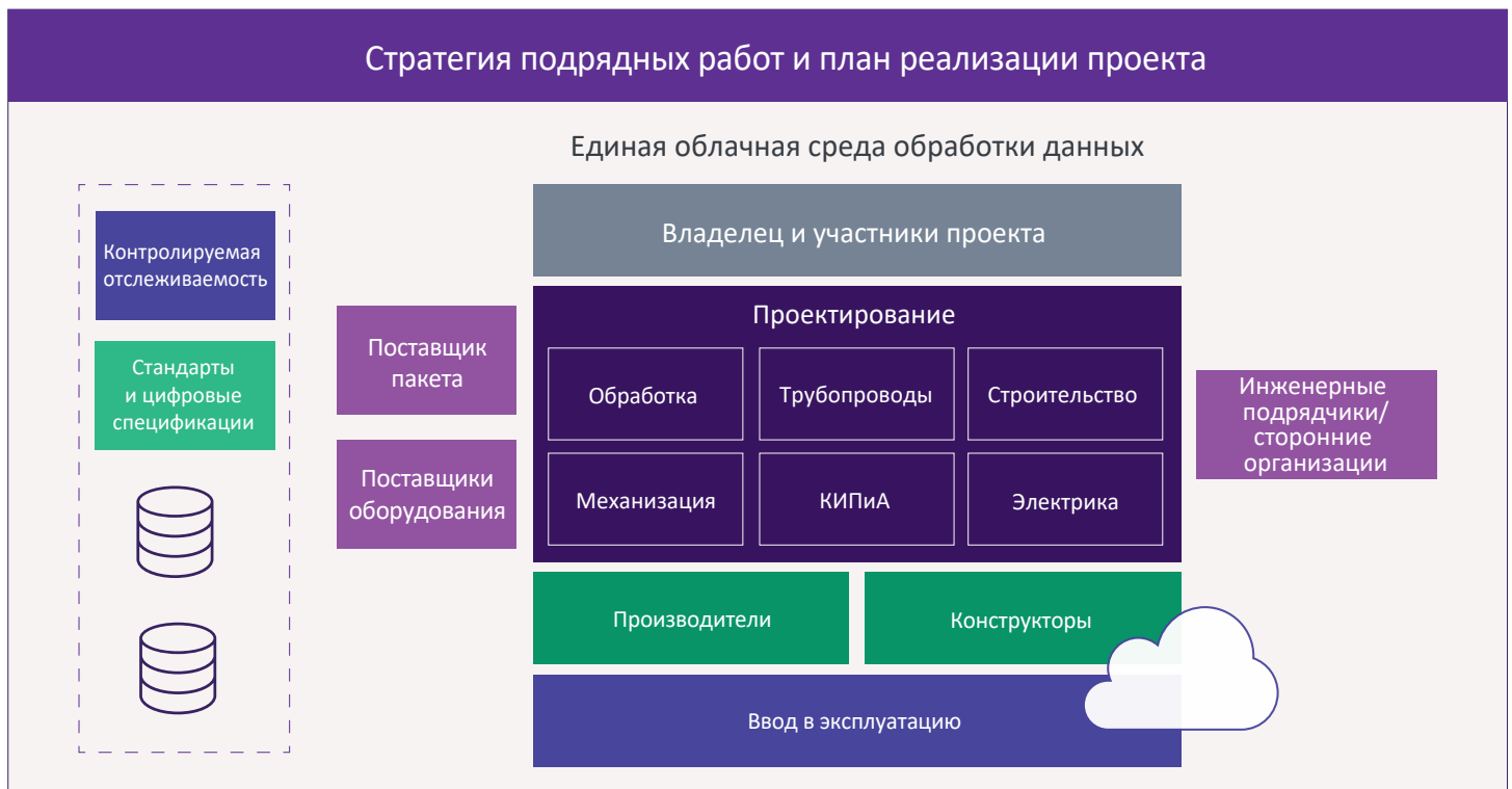
Модель стратегии AVEVA EPC 4.0 в облаке

Наши решения для проектов капитального строительства и создания цифровых двойников охватывают весь жизненный цикл активов и обеспечивают моделирование процессов и техническое проектирование , реализацию проектов , и обучение . Наши технологии, позволяющие ускорить создание и реализацию проектов, доступны на AVEVA™ Connect — единой облачной платформе, которая позволяет инженерам, поставщикам и клиентам совместно работать в единой среде, охватывающей весь жизненный цикл проекта.